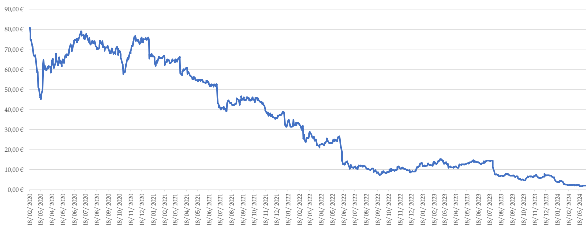
Évolution du cours de l'action Atos entre février 2020-avril 2024

En conséquence, le cours de l'action a chuté de plus de 97 % ces quatre dernières années , avec une volatilité du titre qui s'est accentuée à compter de juin 2022. Euronext Paris a dû déclencher plus de 70 fois ses mécanismes de protection des marchés et Atos est aujourd'hui considérée comme l'entreprise française la plus exposée à la vente à découvert, qui représente de l'ordre de 20 % de son capital.