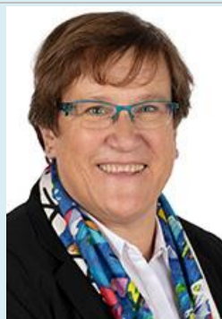
Mme Else JOSEPH Membre du groupe d'information Sénateur (Les Républicains) des Ardennes