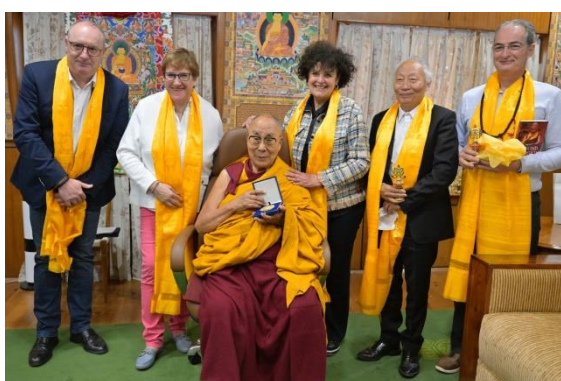
La délégation lors de son audience privée avec le Dalaï Lama

Conscient des difficultés actuelles au Tibet, le Dalaï Lama reste cependant à sa place de chef spirituel et garde l'espoir en la force des Tibétains pour préserver leur culture, leur religion et leur identité, tout en respectant cette « voie du milieu » qu'il a toujours défendue.