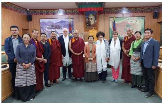
La délégation avec des membres du Parlement