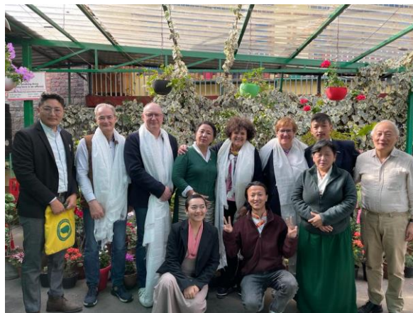
La délégation avec les représentants de plusieurs ONG

La population tibétaine continue à subir, par les autorités chinoises, une politique de sinisation dûment planifiée , avec notamment la mise en place d'internats forcés et la marginalisation de la langue tibétaine dans l'enseignement par l'impossibilité de suivre des études autrement qu'en chinois.