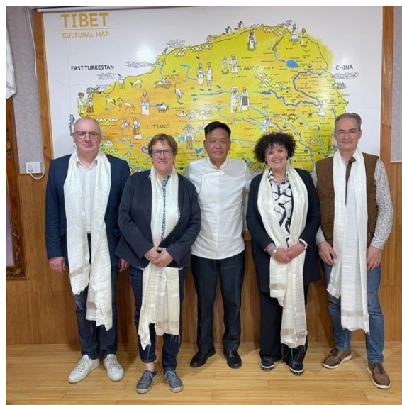
La délégation sénatoriale aux côtés du Sikyong, Penpa Tsering

Lors d'un entretien avec la délégation, le Sikyong a exprimé sa très forte inquiétude concernant les internats obligatoires, qui en quelques années, feront des enfants tibétains, des enfants chinois, coupés de leur culture.