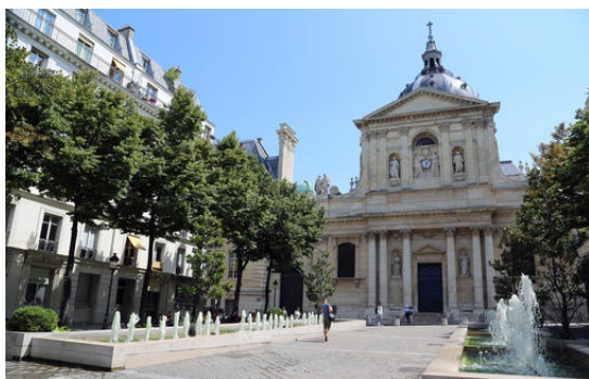
La Sorbonne, Paris

Enfin, les moyens de la promotion du tourisme sont en baisse. Le 4ème Conseil interministériel du tourisme du 17 mai 2019 a demandé à Atout France d'importantes économies sur ses coûts de fonctionnement, c'est-à-dire principalement en termes de ressources humaines et d'immobilier.