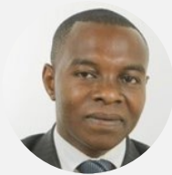
Thani Mohamed Soilihi

Président de la commission Sénateur (Les Républicains) du Rhône