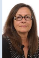
Mme Christine Prunaud sénatrice des Côtes-d'Armor

Le rapport complet est disponible sur le site du Sénat : http://www.senat.fr/rap/a19-142-6/a19-142-6.html