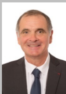
Arnaud BAZIN Sénateur du Val d'Oise (Groupe Les Républicains)