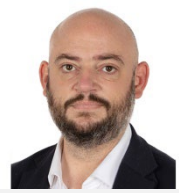
Thomas DOSSUS Rapporteur spécial Sénateur (Groupe Écologiste - Solidarité et Territoires) du Rhône