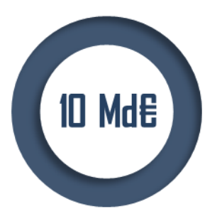
Budget global du PIA 3