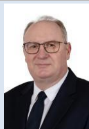
M. Olivier RIETMANN Sénateur de la Haute-Saône (Les Républicains)

Composition du groupe d'amitié : http://www.senat.fr/groupe-interparlementaire-amitie/ami_.html