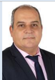
M. Hussein BOURGI Sénateur de l'Hérault (Socialiste, Écologiste et Républicain)