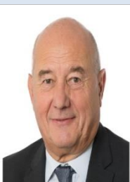
M. Serge BABARY Président de la délégation sénatoriale aux entreprises Sénateur d'Indre-et-Loire (Les Républicains)