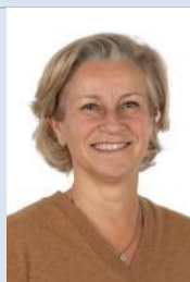
Mme Nadine BELLUROT Sénatrice de l'Indre (Les Républicains – rattachée)