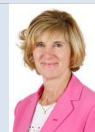
Mme Catherine BELRHITI Sénatrice de la Moselle (Les Républicains)