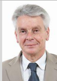
M. Alain Richard Président du groupe Sénateur du Val-d'Oise (Socialiste et républicain)