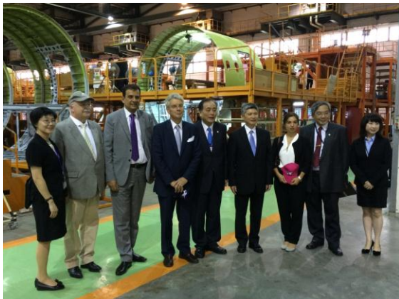
Visite par la délégation sénatoriale de l'Aerospace industry development corporation (AIDC)

La délégation a pu mesurer l'importance de ces secteurs et de leur capacité d'innovation et d'agrégation de l'innovation encouragée par le Gouvernement lors de la visite de l'Institut National Chung-Shan de Science-Technologie et du Parc Scientifique et Industriel de Hsinchu. Si quelque cent-soixante entreprises françaises sont déjà installées à Taïwan – principalement dans la distribution, les biens de consommation, les hautes technologies et l'environnement –, le Gouvernement taïwanais exhorte la France à considérer Taïwan comme une terre d'opportunités pour les entrepreneurs hexagonaux, invités à s'installer en plus grand nombre sur l'île.