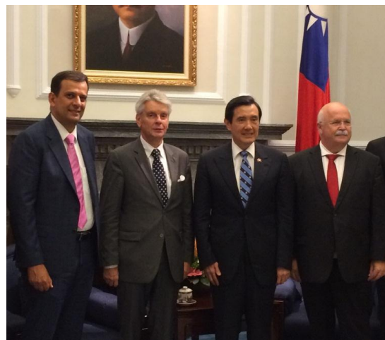
Audience avec M. Ma Ying-jeou, Président de la République de Chine-Taiwan

également tenu à rappeler que Taïwan et la France partageaient les mêmes valeurs (démocratie, droits de l'Homme, paix).