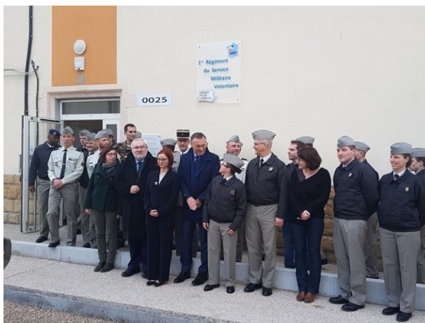
Déplacement des rapporteurs au 1 er régiment du SMV de Montigny-lès-Metz.

A l'arrière-plan figurent les vertus prêtées par la mémoire collective au service militaire . Pourtant, la fonction intégratrice du service militaire était déjà sérieusement entamée lorsque celui-ci a été suspendu. Par ailleurs, si tous les objectifs affichés correspondent à des effets que le service militaire a produits dans le passé, le SNU n'aurait, en lui-même, aucune finalité militaire .