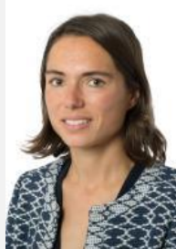
Christine Lavarde Rapporteur spécial Sénateur (Les Républicains) des Hauts-de-Seine

Observation n° 4 : en cumulant les effets de la clause de sauvegarde et des contentieux, que restera-t-il des 3,7 milliards d'euros d'économies escomptés ?