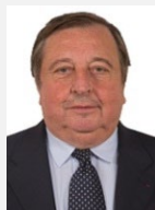
Claude NOUGEIN Rapporteur spécial Sénateur (Les Républicains) de la Corrèze