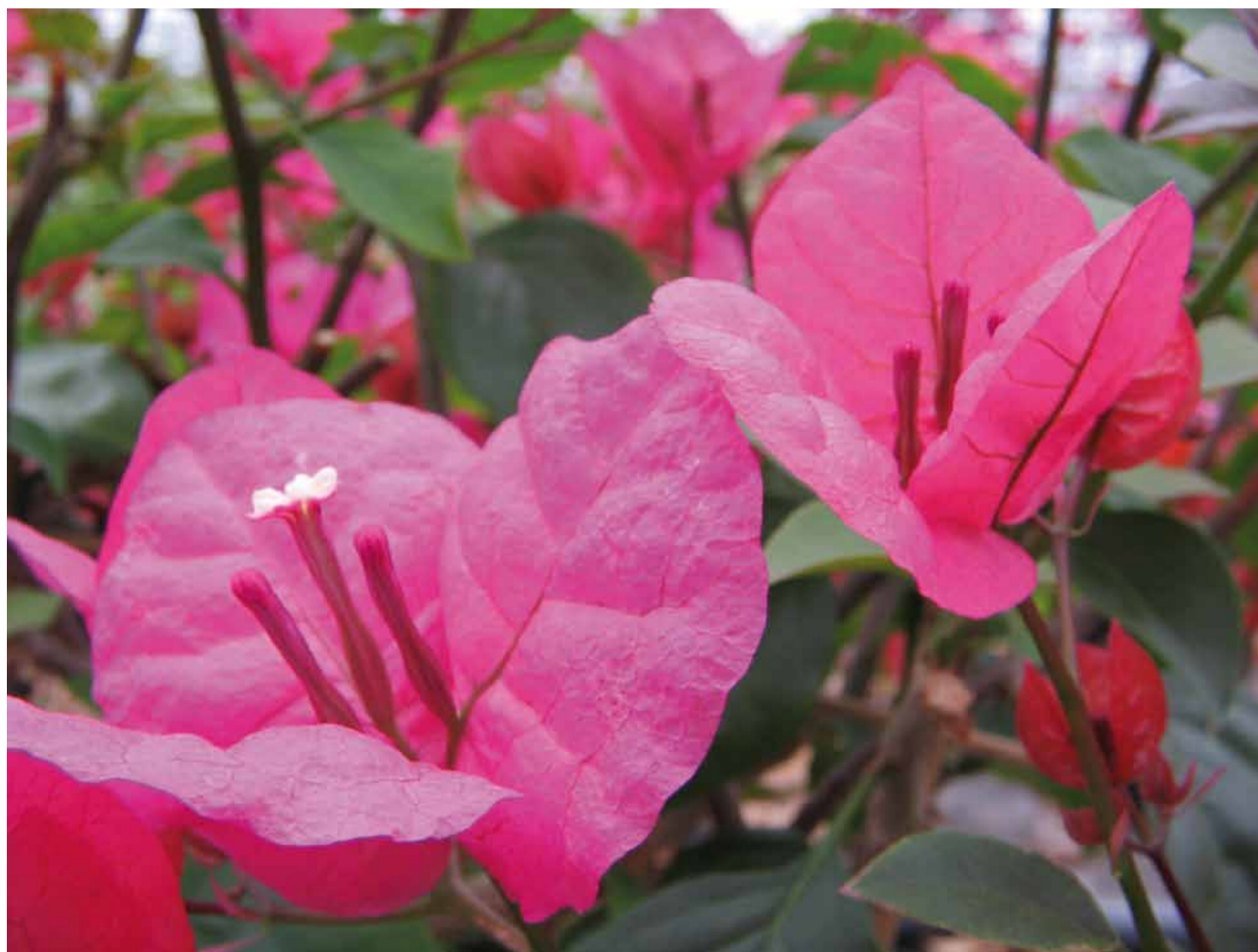
Bougainvillea 'Louisa'

Ainsi un pied de la variété 'Louis Wattan' cultivé à la pépinière du Cannebeth, s'est un jour mis à émettre une branche parée de bractées rose vif, au lieu de sa couleur orange saumonée habituelle. Les tronçons en question ont été prélevés et multipliés et c'est ainsi que la variété 'Louisa' a vu le jour.