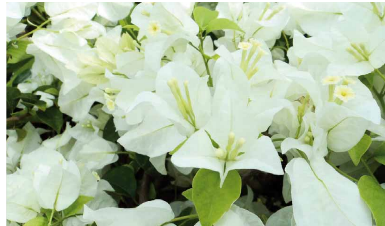
Bougainvillea glabra 'Snow White'

La nouveauté annoncée pour 2013 est le bougainvillier naturellement retombant du plus bel effet en jardinière ou suspension. Tout droit venu des Caraïbes, il éblouit par sa couleur feu et l'abondance de sa floraison. Les Pépinières du Cannebeth dévoileront le nom de ce petit nouveau au Salon du Végétal en février 2013.