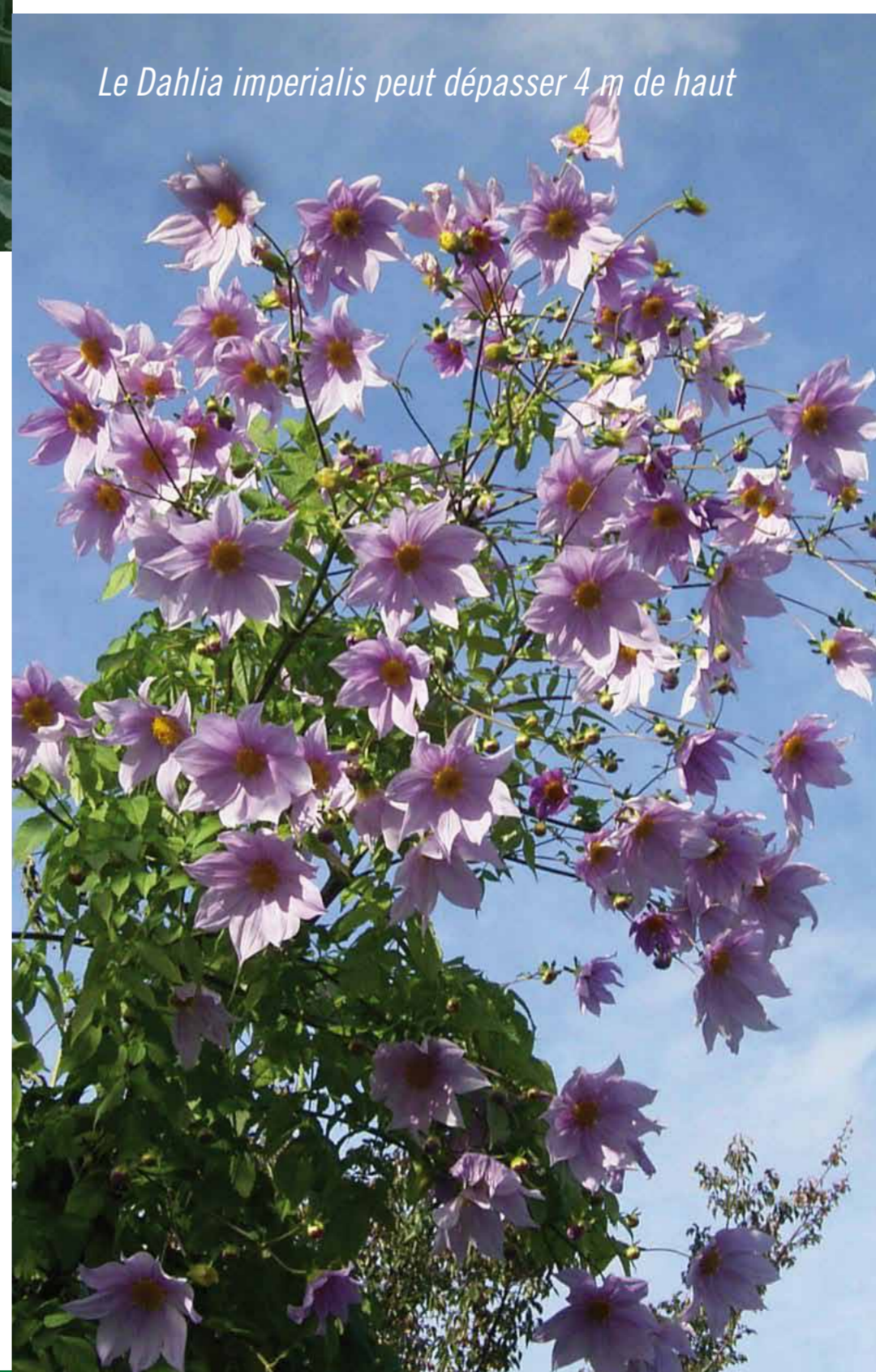
Le Dahlia imperialis peut dépasser 4 m de haut

Le dahlia propose une variété exceptionnelle de tailles, de couleurs et de formes. Fleurs simples, sphériques, à collerettes, fleurs d'orchidées, cactus ; il existe 13 formes différentes de fleurs de tous les coloris, sauf le bleu. Leur taille varie de quelques centimètres de diamètre à plus de 25 cm. La taille de la plante, elle-même, est très variable : d'une quarantaine de centimètres pour les dahlias nains jusqu'à quatre mètres pour le Dahlia imperialis .