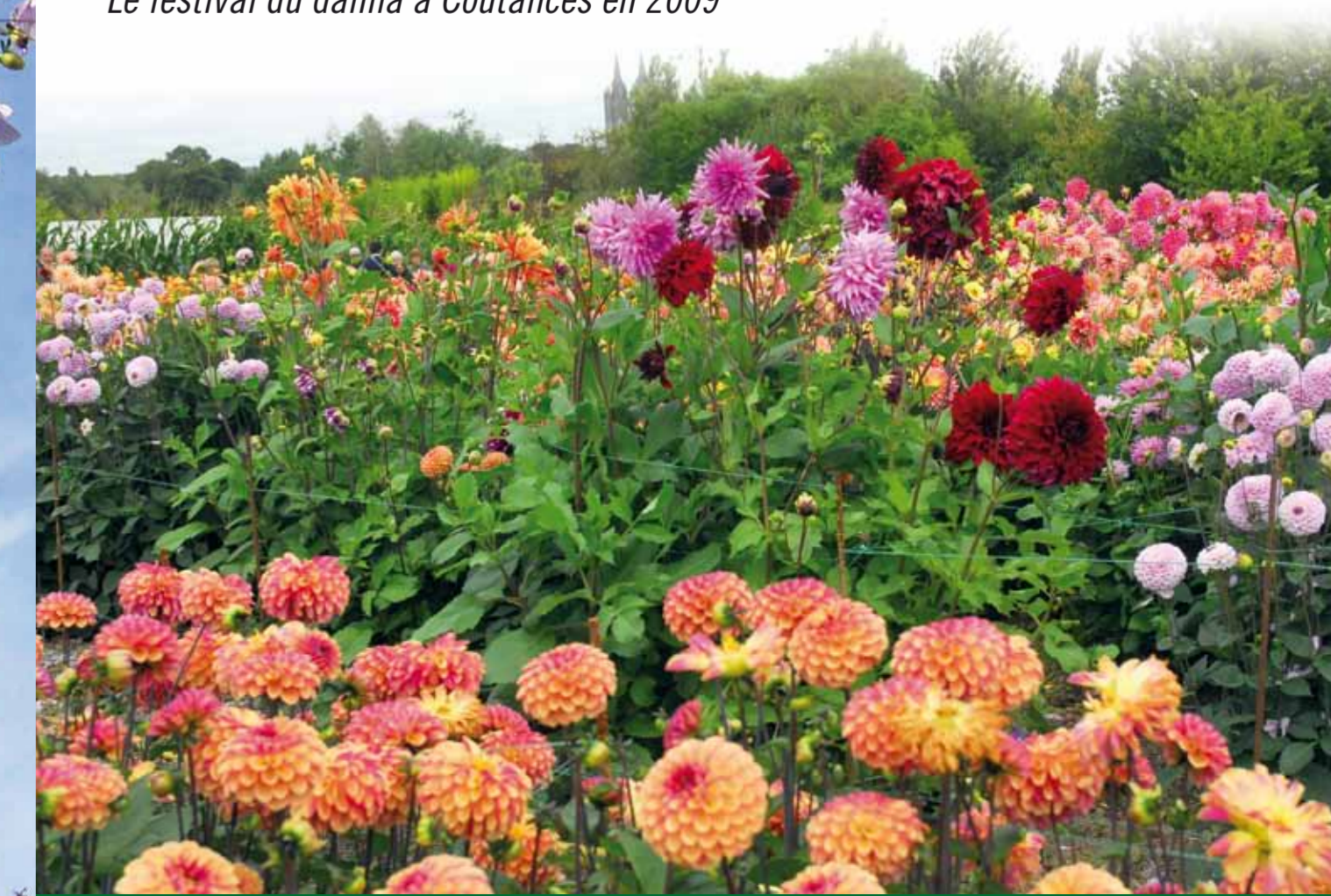
Le festival du dahlia à Coutances en 2009

À Paris, le Parc Floral situé dans le bois de Vincennes présente une collection de dahlias, ainsi que des nouvelles obtentions jugées chaque année à l'occasion d'un concours. À Lyon, le Parc de la Tête d'Or, présente une collection issue préférentiellement de variétés cultivées avant 1920, associées à des nouveautés. Dans la Manche, à Flamanville, la Société Française du Dahlia (SFD) présente 800 taxons dans le parc du château. Le lycée de Coutances organise, quant à lui, le mondial du Dahlia en septembre.