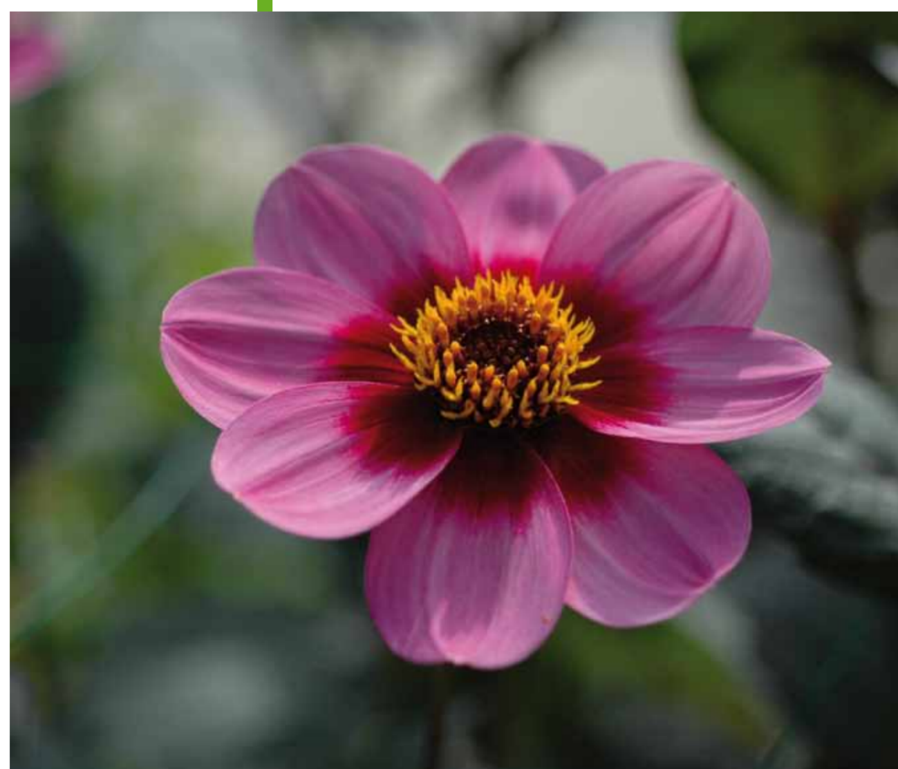
L'inflorescence en capitule est composée d'un grand nombre de fleurs ligulées et de fleurs tubuleuses. Dahlia 'Happy Finger Wink'