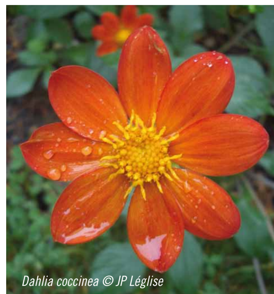
Dahlia coccinea