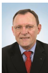
M. Bruno Sido Sénateur Premier vice-président de l'OPECST