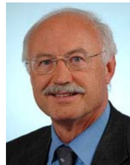
Jean-Louis TOURAINE Député du Rhône