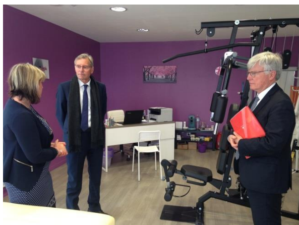
Maison de santé de Rozoy-sur-Serre (02)