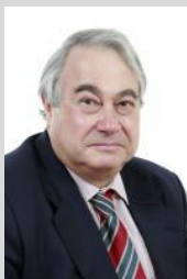
Rapporteur Jean-Noël Cardoux Sénateur (Les Républicains) Loiret (Centre-Val de Loire)