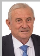
Michel Forissier Sénateur du Rhône (Groupe Les Républicains)