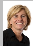
Frédérique Puissat Sénateur de l'Isère (Groupe Les Républicains)