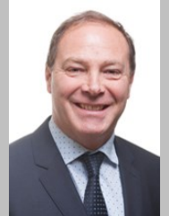
Vincent DELAHAYE Rapporteur Sénateur de l'Essonne (Groupe Union Centriste)

Le présent document et le rapport complet n°709 (2019-2020) sont disponibles sur le site du Sénat :