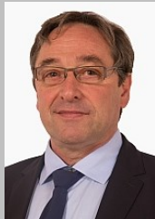
Éric JEANSANNETAS Président Sénateur de la Creuse (Groupe RDSE)