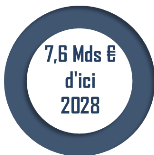
Travaux nécessaires sur les petites lignes ferroviaires