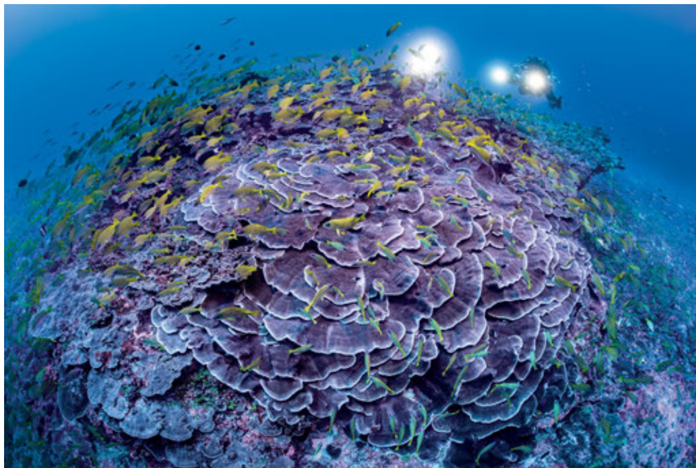
Le mont La Pérouse, en plein océan, à 90 milles marins des côtes réunionnaises. Les explorations de Laurent Ballesta sur ce mont sous-marin culminant à 60 mètres sous la surface de l'eau ont permis de dresser le premier inventaire biologique du site.

Un voyage « au-delà des mers » exceptionnel, à ne pas manquer, pour entrevoir la grandeur et la splendeur d'un héritage naturel inestimable, unique au monde.