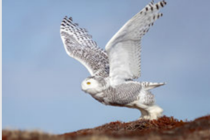
Sur l'île de La Réunion, les pentes de la Ravine Creuse, où une végétation d'altitude a recolonisé la roche volcanique. Un harfang des neiges à Saint-Pierre-et-Miquelon, l'archipel aux plus de 300 espèces d'oiseaux.