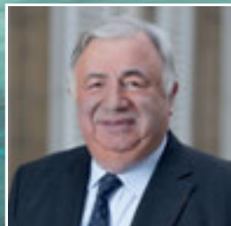
GÉRARD LARCHER PRÉSIDENT DU SÉNAT

Pour la première fois depuis 2000, date de la création des expositions sur les grilles du Jardin du Luxembourg, les Outre-mer sont à l'honneur.