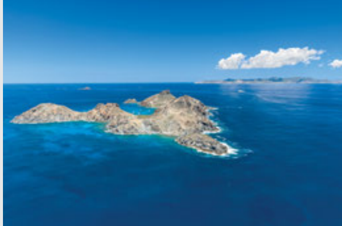
Le saut d'une baleine à bosse dans la Réserve naturelle nationale de Saint-Martin. / L'île Fourchue, avec Saint-Martin à l'horizon. Cet îlet inhabité fait partie de la Réserve naturelle nationale de Saint-Barthélemy créée en 1996.