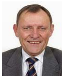
M. Bruno SIDO, Sénateur de la Haute-Marne, Président de l'OPECST