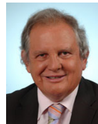
JEAN-YVES LE DÉAUT, député de Meurthe-et-Moselle