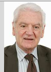
M. Philippe MADRELLE Vice-président du groupe Sénateur (SOC) de la Gironde