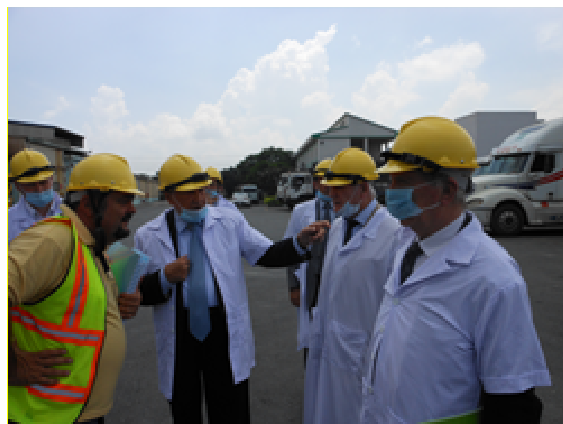
La délégation du Sénat sur le site agro-alimentaire de la coopérative Invivo NSA, dans la province de Bing Duong

Les échanges, qui se sont déroulés dans une atmosphère chaleureuse, ont permis de souligner l'importance de plusieurs travaux d'infrastructure pour la relation bilatérale.