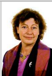
Mme Marie-Christine BLANDIN Présidente de la commission de la culture Sénatrice (ECOLO) du Nord