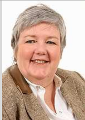
Mme Jacqueline GOURAULT Vice-présidente du groupe Sénatrice (UDI-UC) de Loir-et-Cher