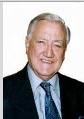
M. Christian PONCELET Président du groupe Sénateur (UMP) des Vosges