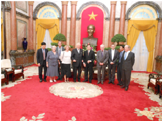
Le Président de la République socialiste du Vietnam, Son Exc. M. Truong Tan Sang recevant la délégation du Sénat, le 11 septembre 2013

À titre personnel, le Président Christian Poncelet s'est fortement impliqué dans le resserrement des relations bilatérales, tant dans le domaine politique qu'en matière de coopération : soutien à l'hôpital de Hanoï et à l'Institut du cœur – Fondation Carpentier à Hô Chi Minh ville, au Festival de Hué et à la restauration de maisons traditionnelles, également dans l'ancienne capitale royale, octroi de bourses à des étudiants vietnamiens en France... Lors de son précédent voyage au Sénat, en octobre 2010, à l'occasion des cérémonies du millénaire de Hanoï, il avait officiellement représenté le Président de la République française.