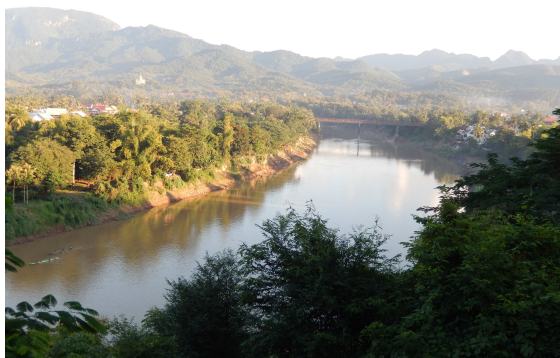
Le site de Luang Prabang