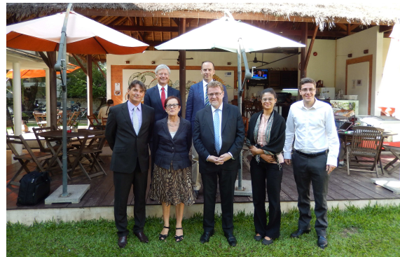
La délégation et l'équipe de l'Institut français

Il assure également la promotion de l'action culturelle extérieure de la France en matière d'échanges artistiques, de diffusion du livre et du cinéma.