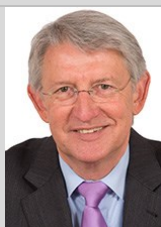
M. Yannick VAUGRENARD Président du groupe d'amitié Sénateur de Loire-Atlantique (SOCR)