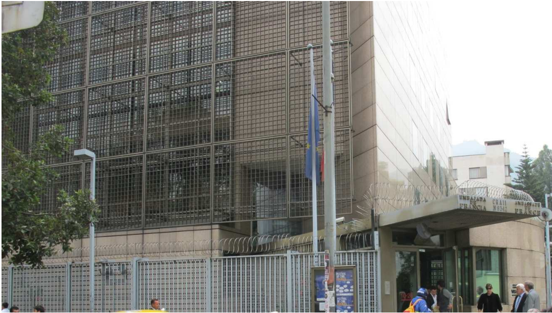
La Nouvelle Alliance française de Bogotá

Toutefois, le développement des Alliances françaises se heurte en Colombie à la loi de proportionnalité qui interdit d'employer plus de 10 % d'étrangers dans ses effectifs. Cela pose une vraie difficulté dans les établissements culturels et d'enseignement linguistiques étrangers.