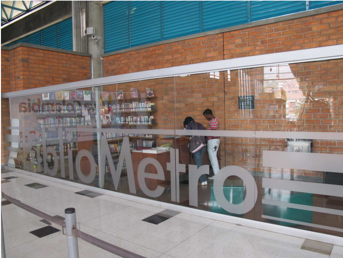
Tramway de Medellín et ses bibliothèques

A la différence des autres grandes villes colombiennes, Medellín gère directement les services publics d'eau, d'électricité ou de téléphone via une entreprise qu'elle détient à 100 % (Empresas Públicas de Medellín) et qui constitue une source de revenus financiers importante pour la municipalité. Cette entreprise produit environ 28 % de l'énergie de la Colombie et prévoit d'investir 3 milliards de dollars dans le plus grand projet hydraulique du pays, la centrale hydro-électrique d'Iricuando (2400 Mgw), ce qui devrait en faire la plus grande entreprise d'État de Colombie. L'énergie hydro-électrique constitue en effet 99 % de l'énergie de Medellín. Un autre projet de centrale hydro-électrique, Forze 4 , a fait l'objet d'un appel d'offre auquel ont répondu des investisseurs argentins, brésiliens et espagnols. Il est estimé à 1200 millions de dollars.