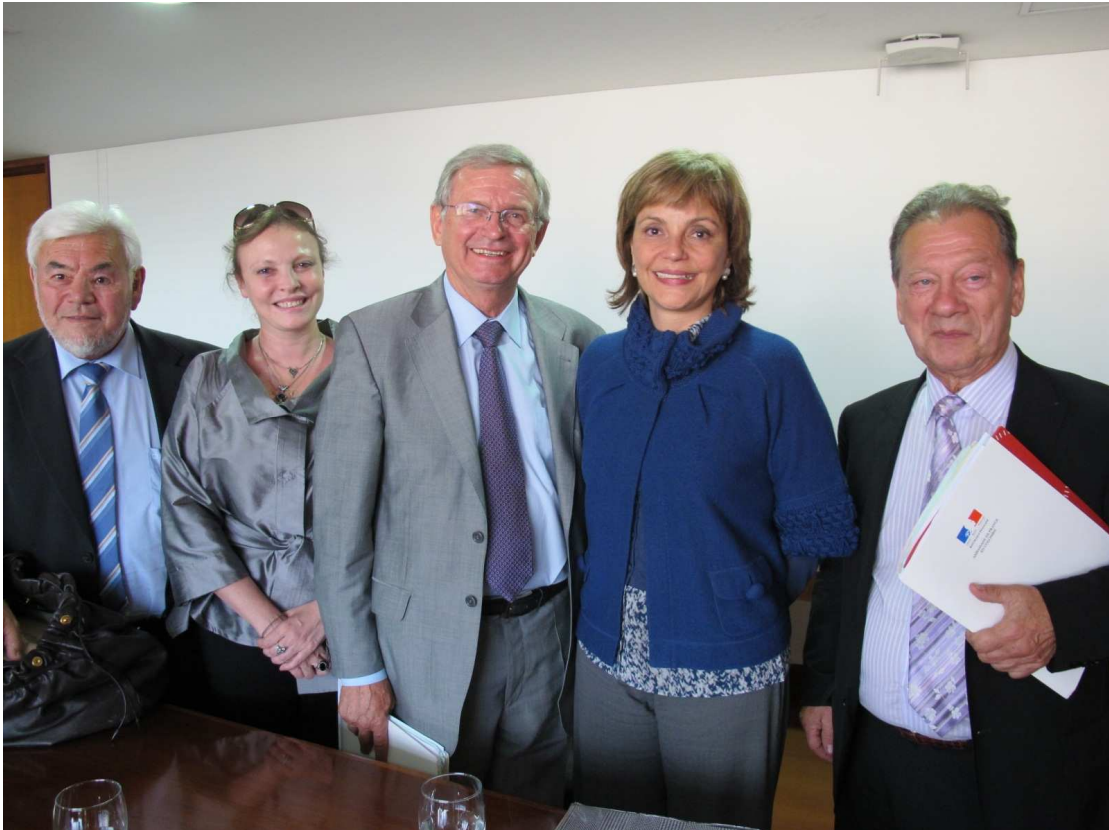
Mme Campo Saavedra, ministre de l'éducation nationale, entourée de la délégation