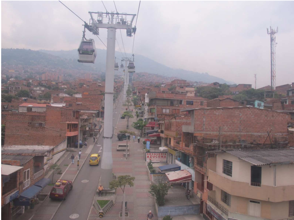
Metrocable de Medellín

Par ailleurs, le maire souhaite également développer le tramway avec deux projets de lignes : le premier, long de 15 kms et financé par l'Agence française de développement 38 , permettra de faire revivre un axe historique et de désenclaver, grâce aux deux lignes de Metrocable associées, un quartier populaire très touché par la violence ; et le second, de 4 kms, dans l'ouest de la ville, plus complet en termes d'impact urbanistique global sur la ville, et pour lequel l'objectif est de laisser à la prochaine équipe municipale l'étude technique détaillée, et, si possible, un plan de financement.