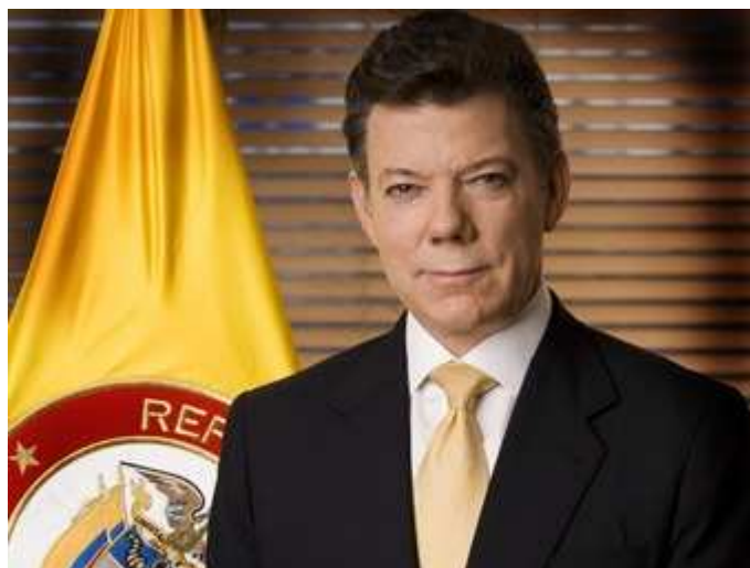
M. Juan Manuel Santos

Cette image positive s'est d'ailleurs traduite par la victoire sans équivoque des partis soutenant l'action du Président lors des élections législatives du 14 mars 2010, puis ensuite par celle de Juan Manuel Santos, lors des élections présidentielles de juin 2010.