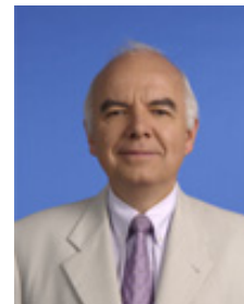
Jean-Pierre Brard, Député de Seine- Saint-Denis