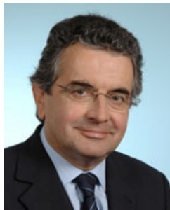
Alain CLAEYS, Député de la Vienne