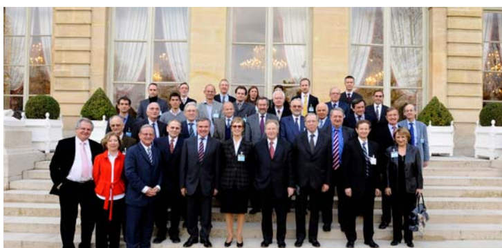
Partenariat avec l'Académie des Sciences. A l'Assemblée nationale avec M. Bernard Accoyer, président de l'Assemblée nationale, le 11 mars 2009.

Au cours de l'année 2009, quatre organismes de recherche ont été visités : le CNRS, l'INRIA, l'INSERM et l'Institut Pasteur ; par ailleurs une délégation de l'OPECST s'est rendue à l'ANR.