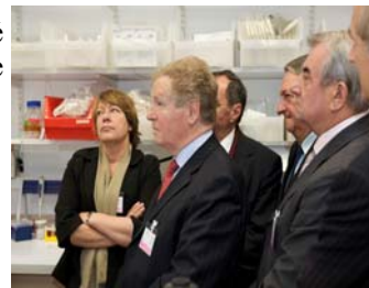
Visite de l'Institut Pasteur

cours desquelles les travaux de l'Office ont été présentés, et des échanges ont eu lieu entre les partenaires parlementaires et scientifiques.