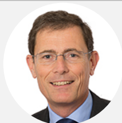
Laurent Lafon Président de la commission, Sénateur du Val-de-Marne (Union Centriste)

Compte tenu de l'ensemble de ces observations, la commission de la culture, de l'éducation et de la communication a émis, lors de sa réunion plénière du 9 novembre 2022, un avis de sagesse sur l'adoption des crédits consacrés au sport au sein de la mission « Sport, jeunesse et vie associative » du projet de loi de finances pour 2023.