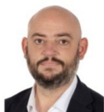
Thomas DOSSUS Rapporteur spécial

Sénateur (Groupe Écologiste - Solidarité et Territoires) du Rhône