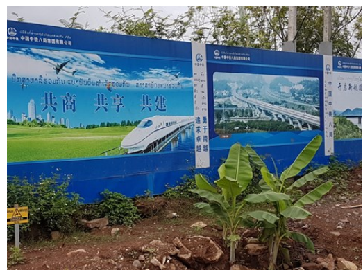
Les nouvelles routes de la soie au Laos

Enfin, cette politique chinoise propose de fait une alternative à l'ordre mondial, hérité de Bretton Woods . La banque asiatique d'investissement dans les infrastructures est apparue comme un instrument financier visant à permettre l'émancipation du système international américano-centré. La décision de créer un marché domestique pour la négociation des contrats à terme sur le pétrole brut libellé en yuan chinois et convertible en or , aux bourses de Shanghai et d'Hong-Kong pourrait constituer un pas décisif dans ce domaine. La Chine, par ses excédents commerciaux et ses réserves de change , dispose des moyens financiers lui permettant de financer des nouvelles routes de la soie, selon ses objectifs.