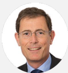
Laurent Lafon Président Sénateur du Val-de-Marne (Union Centriste)

Dans deux ans, la Convention pour la sauvegarde du patrimoine culturel immatériel fêtera son vingtième anniversaire. Elle a été à l'origine d'évolutions déjà très sensibles dans la sauvegarde du PCI. La France a aujourd'hui la chance de disposer d'outils permettant l'identification et la reconnaissance du PCI et d'un réseau d'acteurs assez dense dont la mission est de contribuer à la promotion du PCI. Il reste aujourd'hui à créer les conditions pour fluidifier la sauvegarde du PCI , ce qui suppose de donner une visibilité plus forte à ce type de patrimoine et de mieux accompagner ses détenteurs dans leur ambition de sauvegarde. Un engagement accru des collectivités publiques – collectivités territoriales comme État –, en soutien de l'action des communautés, apparaît comme l'une des clés de la réussite, pour le plus grand bénéfice de la diversité culturelle, des territoires et de nos concitoyens.