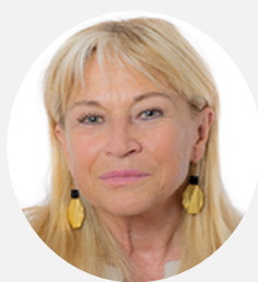
Catherine Dumas Rapporteuse Sénatrice de Paris (Les Républicains)