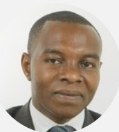
Thani Mohamed Soilihi

Sénateur (Les Républicains) du Tarn-et-Garonne