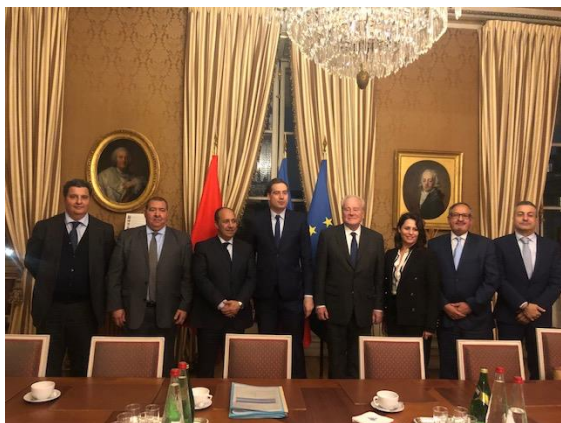
Autour de M. Olivier Becht (au centre), M. Christian Cambon et la délégation.

La visite de la délégation de la Chambre des Conseillers étant concomitante du déplacement au Maroc de la ministre de l'Europe et des Affaires étrangères, Mme Catherine Colonna, un entretien a été organisé au Quai d'Orsay avec M. Olivier Becht, ministre délégué chargé du commerce extérieur, de l'attractivité et des Français de l'étranger.