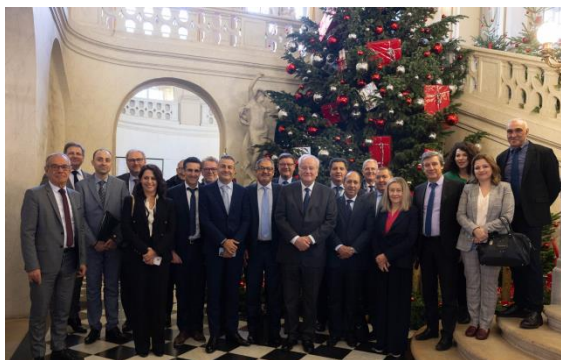
La délégation marocaine et les membres du groupe d'amitié France-Maroc.