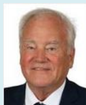
M. Christian CAMBON

Président du groupe d'amitié France-Maroc – Sénateur du Val-de-Marne – (Les Républicains)