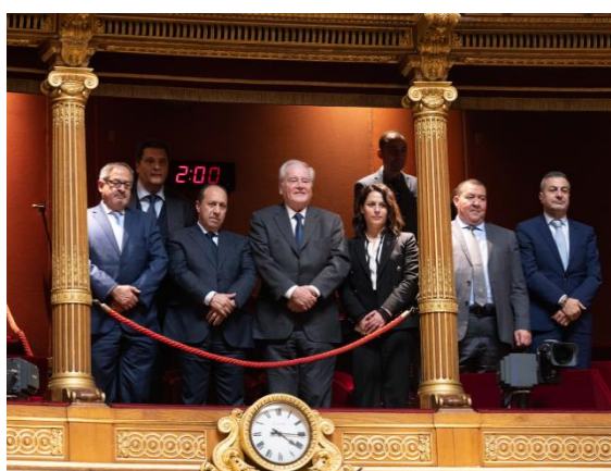
La délégation, en tribune officielle, est saluée en séance publique aux côtés de M. Christian Cambon.

Etape importante de la journée au cours de laquelle la délégation était accueillie au Sénat, un salut officiel en séance publique s'est tenu le mercredi 15 décembre, témoignant ainsi de la relation privilégiée entre les deux assemblées.