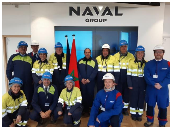
La délégation et M. Christian Cambon, sur le site de Naval Group à Cherbourg.