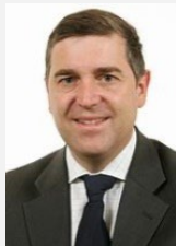
Albéric de Montgolfier Rapporteur spécial Sénateur (Les Républicains) d'Eure-et-Loir

Réunie à nouveau le jeudi 17 novembre 2022, sous la présidence de M. Claude Raynal, président, la commission a décidé de proposer au Sénat d'adopter les crédits du compte d'affectation spéciale « Gestion du patrimoine immobilier de l'État ».