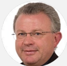
Pascal Allizard Rapporteur Sénateur du Calvados (LR)