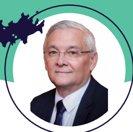
MICHEL MAGRAS Sénateur de Saint-Barthélemy, président de la Délégation sénatoriale aux outre-mer

La délégation est chargée d'informer le Sénat sur l'état de la situation des collectivités visées à l'article 72-3 de la Constitution et sur toute question relative aux outre-mer. Elle veille à la prise en compte des caractéristiques, des contraintes et des intérêts propres de ces collectivités et au respect de leurs compétences. Elle participe à l'évaluation des politiques publiques intéressant ces collectivités.