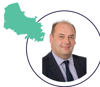
JEAN-FRANÇOIS RAPIN Sénateur du Pas-de-Calais