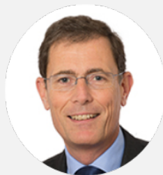
Laurent Lafon Président Sénateur du Val-de-Marne (Union Centriste)