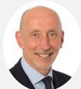
Jean-Raymond Hugonet Co-Rapporteur Sénateur de l'Essonne ( Les Républicains )