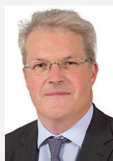
Vincent SEGUIN Rapporteur spécial Sénateur (Les Républicains) de l'Orne

Réunie le mercredi 10 novembre 2021, sous la présidence de M. Claude Raynal, président, la commission des finances a décidé de proposer au Sénat d'adopter sans modification les crédits de la mission et de ne pas adopter les crédits du compte d'affectation spéciale.