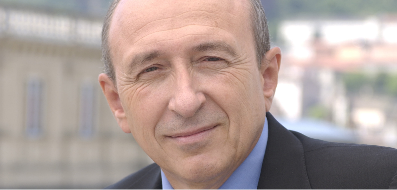
Gérard Collomb, sénateur-maire de Lyon et président de la communauté urbaine de Lyon

des zones d'activités économiques, de la promotion à l'étranger. De la Région, elle pourrait par accord exercer des compétences en matière d'accompagnement des entreprises, d'organisation de l'université et de la recherche, de promotion internationale