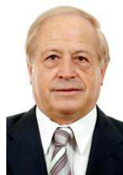
Roland COURTEAU Sénateur de l'Aude

Mercredi 7 juillet 2010 de 14 heures à 18 heures