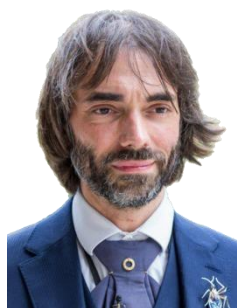
Cédric Villani Député, Premier vice-président de l'Office