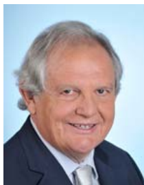
Jean-Yves LE DEAUT, Député de Meurthe-et-Moselle, Premier vice-président de l'OPECST