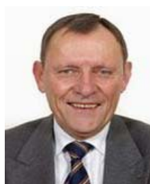
M. Bruno SIDO, Sénateur de la Haute-Marne, Président de l'OPECST