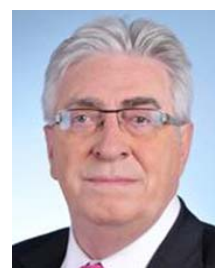
Christian BATAILLE, Député du Nord, Vice-président de l'OPECST