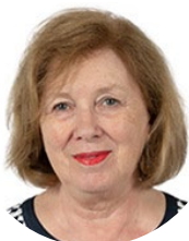
Catherine Deroche Sénateur (LR) de Maine-et-Loire Présidente

Le dispositif répond en particulier à la situation de la Guadeloupe, où l'établissement public existant a un statut d'établissement public administratif (EPA) qui l'empêche d'intervenir dans le champ concurrentiel. La commission propose d'adopter cet article en saisissant cette occasion pour supprimer des dispositions inappliquées et obsolètes.