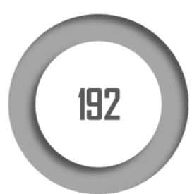
Nombre de centres de santé gérés par des collectivités territoriales

L'article 33 précise que les professionnels – administratifs ou de santé – exerçant, sous le régime du salariat, au sein des centres de santé créés et gérés par des collectivités territoriales peuvent être des agents de ces collectivités. Cette mesure présentée dans un objectif de sécurisation juridique consacre une pratique existante. Elle ne lève pas toutefois les limites des statuts existants en matière notamment de continuité de carrière des médecins de ces centres. La commission a adopté cet article sous réserve d'un amendement ajoutant la référence aux groupements également susceptibles de créer et de gérer de tels centres.