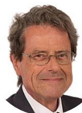
Alain Milon Sénateur (LR) de Vaucluse Rapporteur