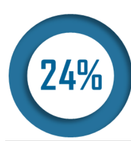
Part des centres de santé médicaux ou polyvalents gérés par des collectivités