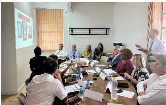
Réunion à l'ambassade de France sur la lutte contre les trafics

Une réunion organisée le 25 février à l'ambassade de France à Castries (Sainte-Lucie) a rassemblé l'ensemble des acteurs engagés dans la lutte contre les trafics : attaché de sécurité intérieure, magistrat de liaison, directeur régional de l'Office anti-stupéfiants, attaché des douanes régional, gendarmerie de Martinique, représentant de l'Action de l'État en Mer et procureur du JIRS de Martinique (juridiction interrégionale spécialisée).