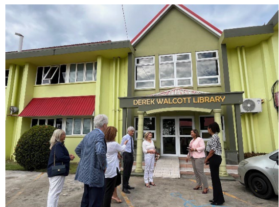
La délégation devant la bibliothèque de l'Université de Sir Arthur Lewis Community College

Sainte-Lucie a la particularité de compter parmi ses nationaux deux lauréats du Prix Nobel, fait remarquable au regard de sa population de seulement 180 000 habitants. Sir Arthur Lewis, prix Nobel d'économie en 1979, a ainsi donné son nom à l'une des principales universités du pays, qui accueille également la bibliothèque Derek Walcott, du nom du prix Nobel de