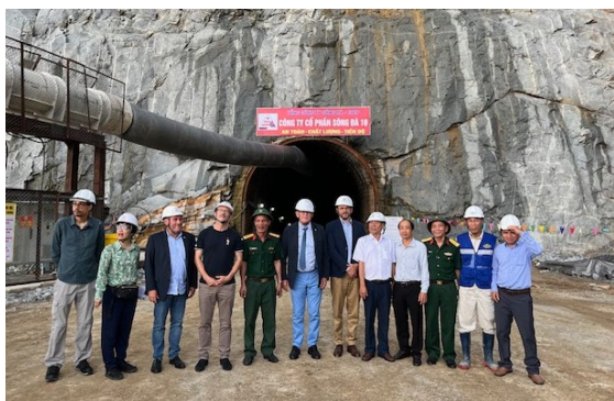
Visite du chantier de la station de pompage-turbinage de Bac-Ai, financée par l'AFD dans le cadre de son mandat « 100% climat »

À ce titre, la délégation sénatoriale a eu l'occasion de visiter le chantier de la station de pompage-turbinage hydro-électrique de Bắc-Âi , projet majeur du programme JETP porté par l'AFD, d'une capacité de 1200 MW.