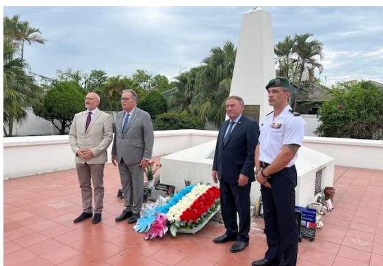
La délégation a rendu hommage aux soldats français morts à Điện Biên Phủ, en présence de la mission de Défense de l'Ambassade de France au Vietnam

La délégation s'est rendue sur les principaux sites de la bataille de Điện Biên Phủ – colline Gabrielle, pont Bailey, PC Gono, mémorial français et cimetière vietnamien. Une gerbe a été déposée au pied du mémorial dédié aux combattants français qui ont péri lors des affrontements. Ce déplacement a également été l'occasion de constater les efforts déployés par la France pour préserver et valoriser ces lieux de mémoire ; un parcours mémoriel a notamment été installé sur les berges de la rivière Nam Rom avec le soutien de l'AFD.