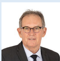
Alain CADEC Président du groupe d'amitié Sénateur (app. LR) des Côtes-d'Armor