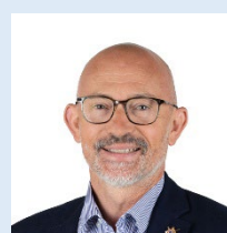
Olivier PACCAUD Sénateur (LR) de l'Oise

Composition du groupe : http://www.senat.fr/groupe-interparlementaire-amitie/ami_626.html