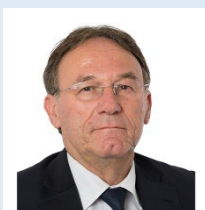
Patrice JOLY Vice-président du groupe d'amitié Sénateur (SER) de la Nièvre