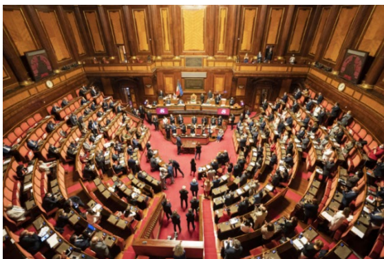
Hémicycle du Sénat de la République Italienne

Le Sénat de la République Italienne ( Senato della Repubblica ), institué après la fin de la monarchie, trouve ses racines dans le référendum constitutionnel du 2 juin 1946, qui transforma l'Italie en République. Le décret législatif n°48 du 24 juin 1946 acte la cessation du Sénat monarchique, suivi par la loi constitutionnelle n°3 du 14 novembre 1947, qui en prononce la dissolution définitive.