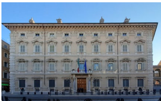
Le Palais Madama, siège du Sénat à Rome

Durant la période fasciste, le Sénat continue formellement d'exister alors que les partis d'opposition sont progressivement exclus, puis interdits. Bien que composé de membres nommés à vie et susceptible de jouer un rôle de contrepoids institutionnel, le Sénat a, dans la pratique, essentiellement validé les orientations du régime. Après la guerre, la fonction législative est provisoirement exercée par la Consulta nazionale (1945-1946), puis par l' Assemblée constituante élue le 2 juin 1946, date du référendum institutionnel consacrant la fin de la monarchie et la naissance de la République. Les débats portent d'abord sur le choix entre monacamérisme et bicamérisme. Le principe d'un Parlement à deux chambres est finalement retenu, malgré des divergences sur la nature et la composition de la seconde chambre.